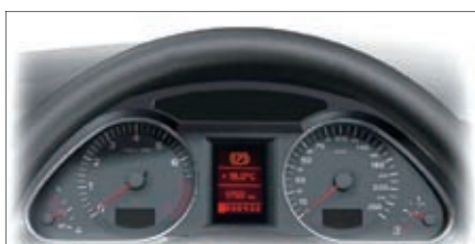
图1 驻车制动故障指示灯点亮