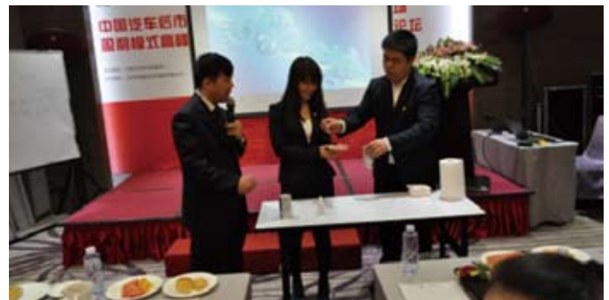
BG养护用品现场演示

本次论坛总结了中国汽车后市场的发展状况，分析了汽车后市场的发展趋势，分享了全新的营销理念、服务模式、运营策略和创新思维。美国BG公司还正式发布了专为中国市场设计的新商标“必朋”，这标志着BG正式开启了全新的中国战略部署。美国BG公司还在论坛现场展示了BG养护用品的抗氧化、抗硫、保护发动机的功效，让业内人士“零距离”见证了BG养护产品的独特功效。